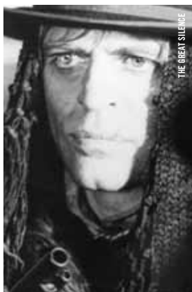
THE GREAT SILENCE

SAMEDI 24 NOVEMBRE 17 h - Salle Claude-Jutra Renoir... littéraire MADAME BOVARY [Fr., 1934, 80 min, 35 mm, VOSTA] PRÉSENTÉ PAR SERGE CARDINAL