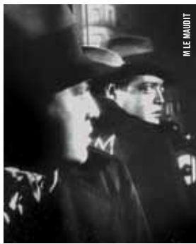
M LE MAUDIT

20 h 30 - Salle Claude-Jutra Images Festival 25 ans A PLACE IN THE WORLD Portrait de la Place Ville Marie Alexandre Larose [Can., 2011, 3 min, 16 mm, SD]; East Hastings Pharmacy Antoine Bourges [Can., 2011, 46 min, HDCAM, VOA]; Third Law: N. Kedzie Blvd. Mike Gibisser [É.-U., 2011, 7 min, HDCAM, VOA]; The Home and the World Lucy Parker [R.-U., 2011, 19 min, 16 mm, VOA] EN PRÉSENCE DE REPRÉSENTANTS DU FESTIVAL