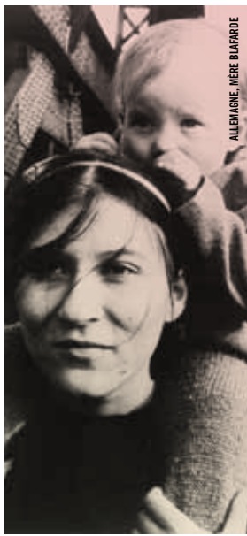
ALLEMAGNE, MÈRE BLAFARDE

19 h - Salle Claude-Jutra Cinéma de genre THE GREAT SILENCE (IL GRANDE SILENZIO) Sergio Corbucci [It.-Fr., 1968, 105 min, 35 mm, VA]