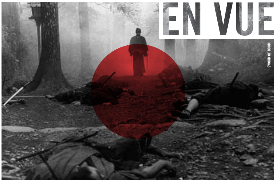
SWORD OF DOOM

·: DU 13 AU 16 DÉCEMBRE ·: Le « film de samouraï » a toujours été pour le cinéma japonais un matériau d'une diversité et d'une complexité remarquables. Bien plus grande d'ailleurs, que ce à quoi le limitent parfois les clichés du genre. Les notions d'honneur, de loyauté et de devoir associées au statut de samouraï, de même que leurs corollaires plus sombres – violence, trahisons et rivalités –, offrent d'innombrables possibilités de variations et d'approches, historiques, morales, ludiques. C'est ce qu'illustre cette sélection de cinq incontournables, de An Actor's Revenge (1935), basé sur un feuilleton populaire, à Sword of Doom (1966), qui pousse jusqu'à ses limites morales et narratives l'idée du guerrier invincible.