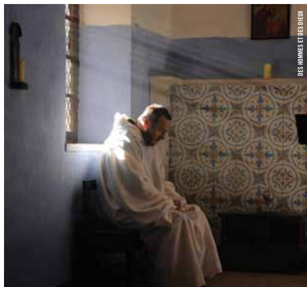
DES HOMMES ET DES DIEUX