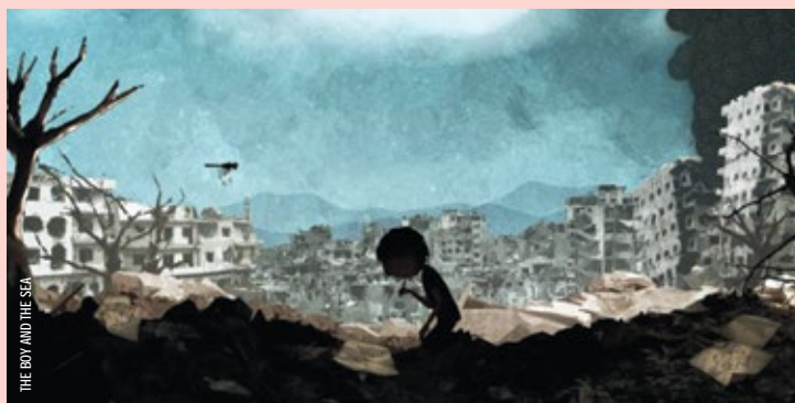
THE BOY AND THE SEA