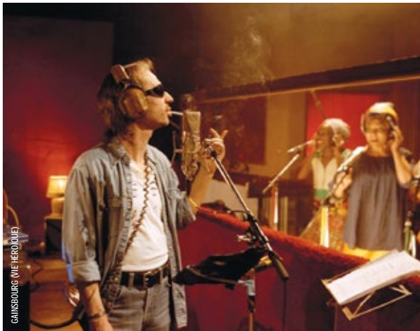
GAINSBOURG (VIE HÉROÏQUE)