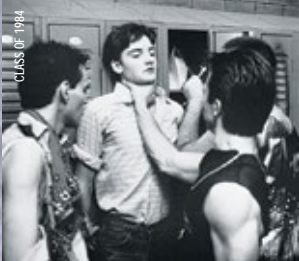
CLASS OF 1984